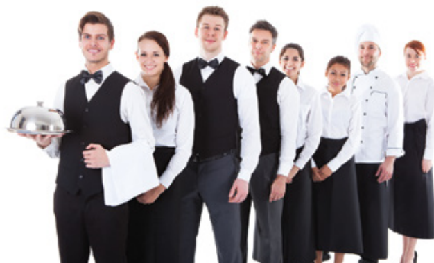
HOTELES Y RESTAURANTES