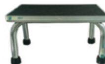
BANQUETA DE ALTURA