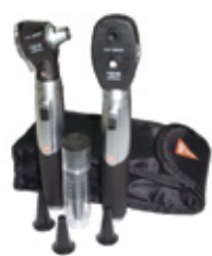
ESTUCHE DE DIAGNÓSTICO