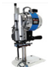
TIJERA PARA TEJIDOS