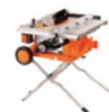
MESA DE CORTE PARA MADERA