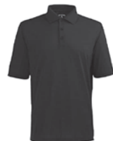
PLAYERAS TIPO POLO