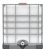
SOSA CAÚSTICA GM. AL 30%