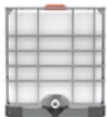
BILSUFITO DE SODIO 30%