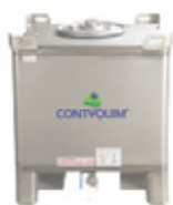
ACETATO DE ETILO