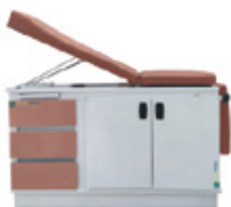
CAMA DE EXPLORACIÓN