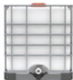
CLORURO DE SODIO AL 1%