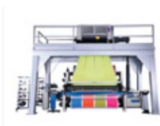
LÍNEA DE COSTURA